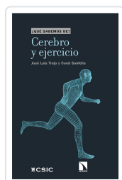
CEREBRO Y EJERCICIO TREJO, JOSÉ LUIS / SANFELIU, CORAL