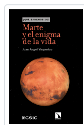
MARTE Y EL ENIGMA DE LA VIDA ÁNGEL VAQUERIZO, JUAN