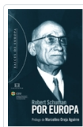
POR EUROPA ENCUENTRO