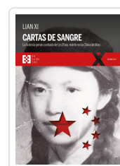
CARTAS DE SANGRE XI, LIAN