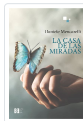
LA CASA DE LAS MIRADAS DANIELE MENCARELLI