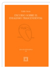
EXCURSO SOBRE EL IDEALISMO TRASCENDENTAL EDITH STEIN