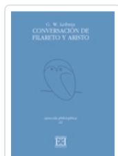
CONVERSACIÓN DE FILARETO Y ARISTO G.W. LEIBNIZ