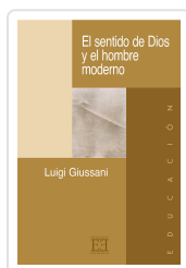
EL SENTIDO DE DIOS Y EL HOMBRE MODERNO GIUSSANI, LUIGI