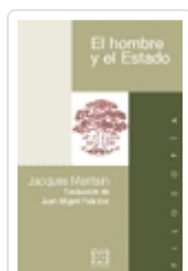
EL HOMBRE Y EL ESTADO JACQUES MARITAIN