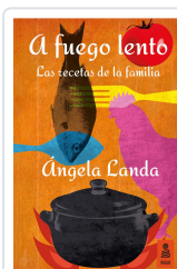
A FUEGO LENTO LANDA APARICIO, ÁNGELA