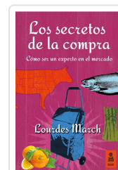
LOS SECRETOS DE LA COMPRA MARCH FERRER, LOURDES