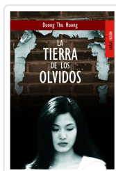
LA TIERRA DE LOS OLVIDOS DUONG THU HUONG