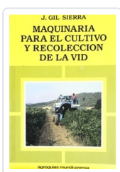
MAQUINARIA PARA EL CULTIVO Y RECOLECCIÓN DE LA VID GIL SIERRA, J.M.