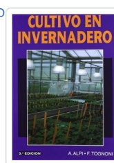
CULTIVO EN INVERNADERO ALPI, A.; TOGNONI, F.