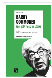
ANTOLOGÍA BARRY COMMONER ECOLOGÍA Y ACCIÓN SOCIAL RIECHMANN, JORGE/TELLECHEA, IRANZU