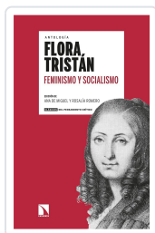
FEMINISMO Y SOCIALISMO TRISTÁN, FLORA