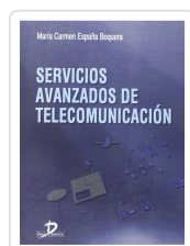
SERVICIOS AVANZADOS DE TELECOMUNICACIÓN ESPAÑA, M.C.