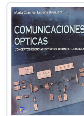
COMUNICACIONES OPTICAS ESPAÑA, M.C.