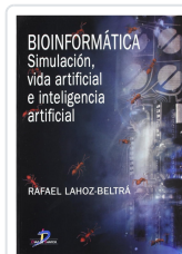
BIOINFORMÁTICA LAHOZ-BELTRA, R.