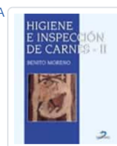
HIGIENE E INSPECCIÓN DE CARNES-II MORENO, B.