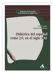
DIDÁCTICA DEL ESPAÑOL COMO 2/L EN EL SIGLO XXI LACORTE, MANEL