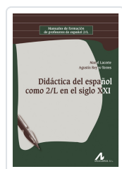
DIDÁCTICA DEL ESPAÑOL COMO 2/L EN EL SIGLO XXI LACORTE, MANEL