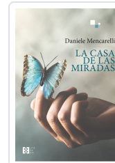
LA CASA DE LAS MIRADAS DANIELE MENCARELLI