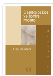
EL SENTIDO DE DIOS Y EL HOMBRE MODERNO GIUSSANI, LUIGI