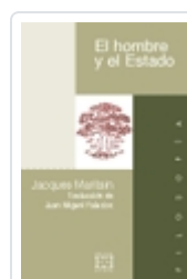
EL HOMBRE Y EL ESTADO JACQUES MARITAIN