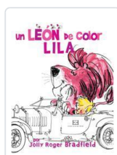
UN LEÓN DE COLOR LILA JOLLY ROGER BRADFIELD