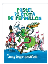
PASTEL DE CREMA DE PEPINILLOS JOLLY ROGER BRADFIELD