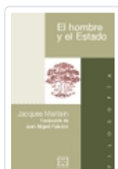
EL HOMBRE Y EL ESTADO JACQUES MARITAIN