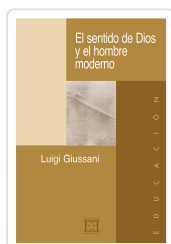
EL SENTIDO DE DIOS Y EL HOMBRE MODERNO GIUSSANI, LUIGI