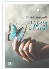
LA CASA DE LAS MIRADAS DANIELE MENCARELLI