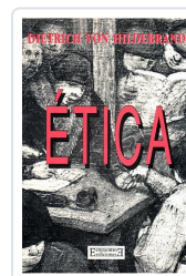
ÉTICA HILDEBRAND, DIETRICH VON