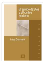
EL SENTIDO DE DIOS Y EL HOMBRE MODERNO GIUSSANI, LUIGI