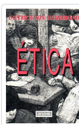
ÉTICA HILDEBRAND, DIETRICH VON