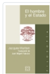
EL HOMBRE Y EL ESTADO JACQUES MARITAIN