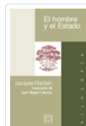
EL HOMBRE Y EL ESTADO JACQUES MARITAIN