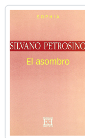
EL ASOMBRO SILVANO PETROSINO