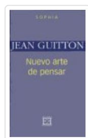
NUEVO ARTE DE PENSAR JEAN GUITTON