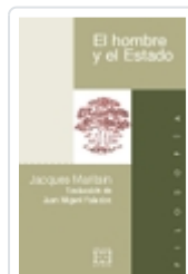
EL HOMBRE Y EL ESTADO JACQUES MARITAIN