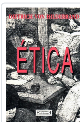
ÉTICA HILDEBRAND, DIETRICH VON