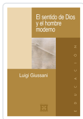
EL SENTIDO DE DIOS Y EL HOMBRE MODERNO GIUSSANI, LUIGI