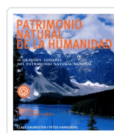
PATRIMONIO NATURAL DE LA HUMANIDAD CLAES GRUNDSTEN, PETER HANNEBERG