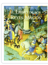
EL LIBRO DE LOS REYES MAGOS JUAN DE HILDESHEIM