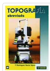
TOPOGRAFÍA ABREVIADA. DOMÍNGUEZ GARCÍA-TEJERO, F.