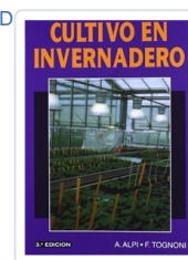
CULTIVO EN INVERNADERO ALPI, A.; TOGNONI, F.