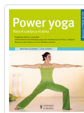
POWER YOGA ALLENDOFF, MARTINA; LEHNERT, ELKE