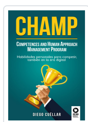
CHAMP CUÉLLAR, DIEGO