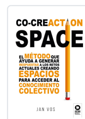
CO-CREACTION SPACE VOS, JAN