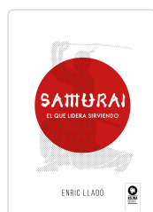
SAMURAI LLADO MICHELI, ENRIC