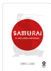
SAMURAI LLADÓ MICHELI, ENRIC