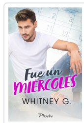
FUE UN MIÉRCOLES G., WHITNEY