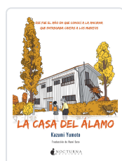
LA CASA DEL ÁLAMO YUMOTO, KAZUMI