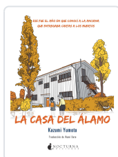
LA CASA DEL ÁLAMO YUMOTO, KAZUMI