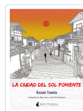
LA CIUDAD DEL SOL PONIENTE YUMOTO, KAZUMI