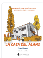
LA CASA DEL ÁLAMO YUMOTO, KAZUMI