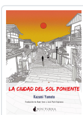
LA CIUDAD DEL SOL PONIENTE YUMOTO, KAZUMI