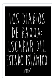
LOS DIARIOS DE RAQQA: ESCAPAR DEL ESTADO ISLÁMICO ISLÁMICO SAMER