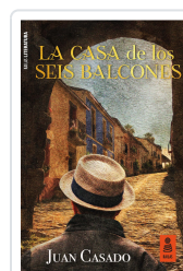
LA CASA DE LOS SEIS BALCONES CASADO FLORES, JUAN