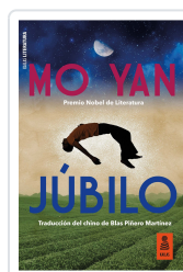
JÚBILO YAN, MO