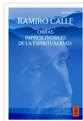
OBRAS IMPRESCINDIBLES DE LA ESPIRITUALIDAD CALLE CAPILLA, RAMIRO