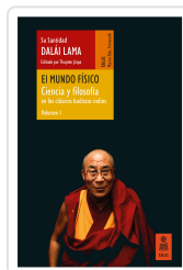
EL MUNDO FÍSICO (CIENCIA Y FILOSOFÍA EN LOS CLÁSICOS BUDISTAS INDIOS, VOL. 1) LAMA, DALÁI