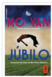
JÚBILO YAN, MO