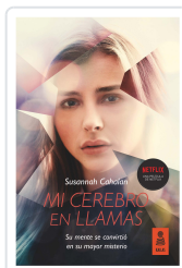
MI CEREBRO EN LLAMAS CAHALAN, SUSANNAH