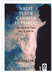
NADIE PUEDE CAMBIAR EL PASADO EXPÓSITO RODRÍGUEZ, LUIS