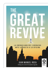
THE GREAT REVIVE ROCA, JUAN MANUEL