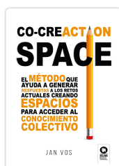
CO-CREACTION SPACE VOS, JAN