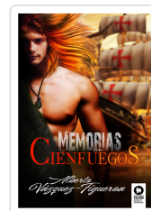
MEMORIAS DE CIENFUEGOS VÁZQUEZ-FIGUEROA, ALBERTO