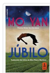
JÚBILO YAN, MO