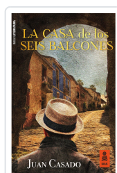
LA CASA DE LOS SEIS BALCONES CASADO FLORES, JUAN