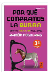
POR QUÉ COMPRAMOS LA BURRA NOGUERAS PÉREZ, RAMÓN