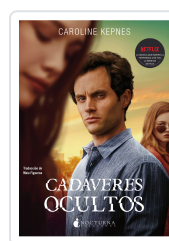
CADÁVERES OCULTOS KEPNES, CAROLINE