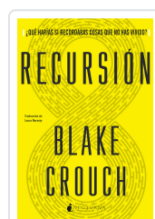
RECURSIÓN CROUCH, BLAKE