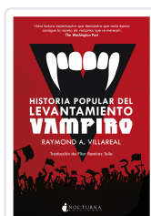
HISTORIA POPULAR DEL LEVANTAMIENTO VAMPIRO VILLAREAL, RAYMOND A.