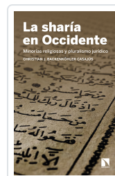
LA SHARÍA EN OCCIDENTE BACKENKÖHLER CASAJÚS, CHRISTIAN J.