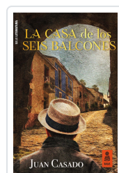
LA CASA DE LOS SEIS BALCONES CASADO FLORES, JUAN