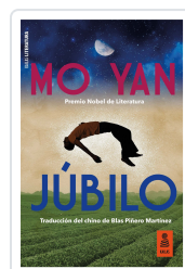
JÚBILO YAN, MO